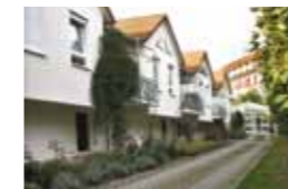
Kleeblatt Oberstenfeld Großbottwarer Straße 42/1 71720 Oberstenfeld