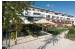
Kleeblatt Asperg Markgröninger Straße 3 71679 Asperg