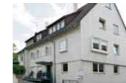
Tagespflege Großsachsenheim Obere Straße 35 74343 Sachsenheim