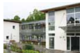
Kleeblatt Freudental Schlossstraße 8 74392 Freudental