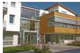
Kleeblatt Affalterbach Seestraße 17 71563 Affalterbach