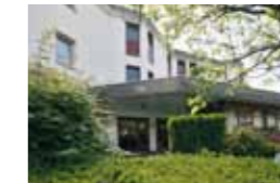
Kleeblatt Tamm Im Länderrain 2 71732 Tamm