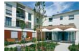
Kleeblatt Löchgau Neue Straße 25 74369 Löchgau