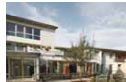
Kleeblatt Großbottwar Schillerstraße 8 71723 Großbottwar