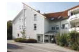
Kleeblatt Steinheim Brühlstraße 53 71711 Steinheim a. d. Murr