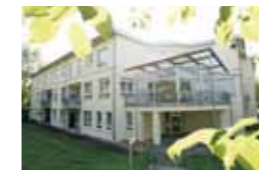
Kleeblatt Möglingen Wiesenweg 30 71696 Möglingen