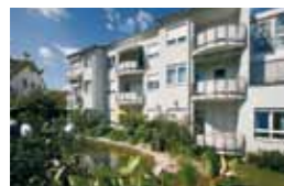
Kleeblatt Bönningheim Amannstraße 20 74357 Bönningheim