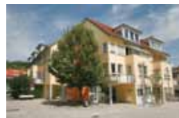
Kleeblatt Asperg Schulstraße 8 71679 Asperg