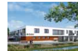
Kleeblatt Tamm Alter Weg 7 71732 Tamm