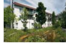
Kleeblatt Hemmingen Lindenstraße 9 71282 Hemmingen