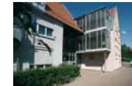
Tagespflege Markgröningen Turmgässle 5 71706 Markgröningen