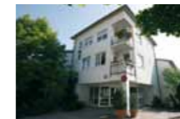
Kleeblatt Remseck Kirchstraße 35 71686 Remseck