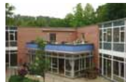
Kompetenzzentrum für Menschen mit Demenz Schlossstraße 8 74392 Freudental