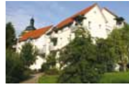
Kleeblatt Erdmannhausen Simanowiz Weg 2 71729 Erdmannhausen