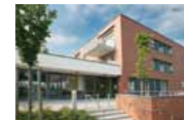
Kleeblatt Pattonville John-F.-Kennedy-Allee 27/1 71686 Remseck