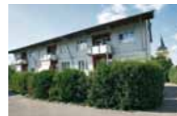
Kleeblatt Großsachsenheim Obere Straße 37 74343 Sachsenheim