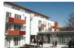
Kleeblatt Kleinsachsenheim Löchgauer Straße 25 74343 Kleinsachsenheim