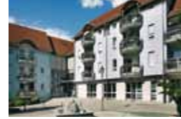
Kleeblatt Gemmrigheim Hauptstraße 16 74376 Gemmrigheim