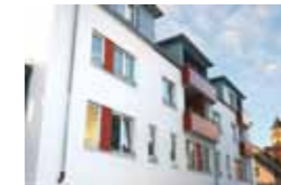
Kleeblatt Schwieberdingen Stuttgarter Straße 4 71701 Schwieberdingen