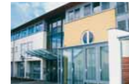
Kleeblatt Murr Beethoven Straße 11 71711 Murr