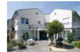
Kleeblatt Schwieberdingen Stettiner Straße 5 71701 Schwieberdingen