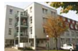
Kleeblatt Ludwigsburg Alt-Württemberg-Allee 4 71638 Ludwigsburg