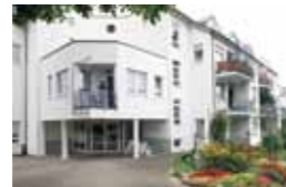
Kleeblatt Freiberg Charlottenstraße 27/29 71691 Freiberg