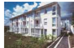
Kleeblatt Markgröningen Auf Hart 65 71706 Markgröningen